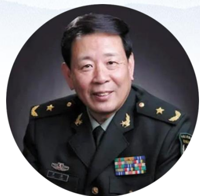
罗 援 军事科学院世界军事研究部原副部长、 全国政协委员、军事科学学会副秘书长