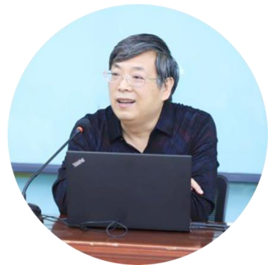
郇庆治 北京大学马克思主义学院教授、博导， 教育部长江学者