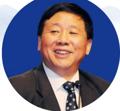
叶小文 全国政协文化文史和学习委员会副主任。 曾任中国共产党第十八届中央委员会委员，国家 宗教局局长，中央社会主义学院党组书记