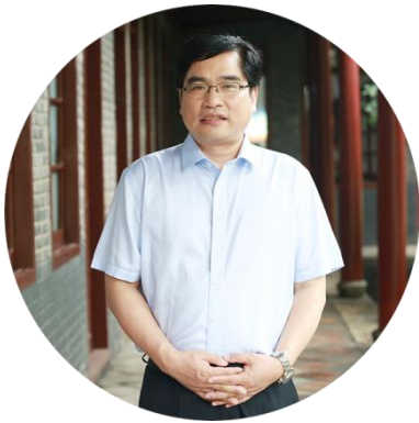
孙来斌 北京大学马克思主义学院教授、博导， 北京市习近平新时代中国特色社会主义思想研究 中心北京大学基地副主任